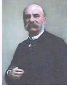
Ch'l'estchulture et pi ch'rétroér sont à vir à fil éd vo visite